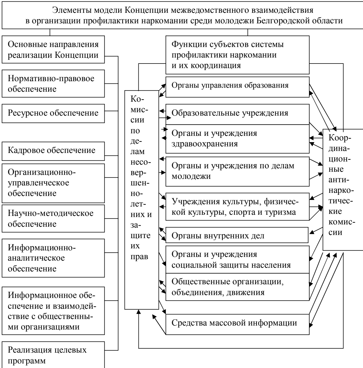
Схема 2. Модель Концепции межведомственного взаимодействия в организации профилактики наркомании среди молодежи Белгородской области, утвержденной постановлением главы администрации Белгородской области от 6 февраля 2003 года № 53

несовершеннолетних и защите их прав, наркологической подростковой службы, органов внутренних дел, органов и учреждений социальной защиты, групп родительского актива 16 . В связи с этим положением Концепции не вполне ясно, какому субъекту отведена функция организации межведомственного взаимодействия: координационным антинаркотическим комиссиям, комиссиям по делам несовершеннолетних и защите их прав или органам управления образованием.