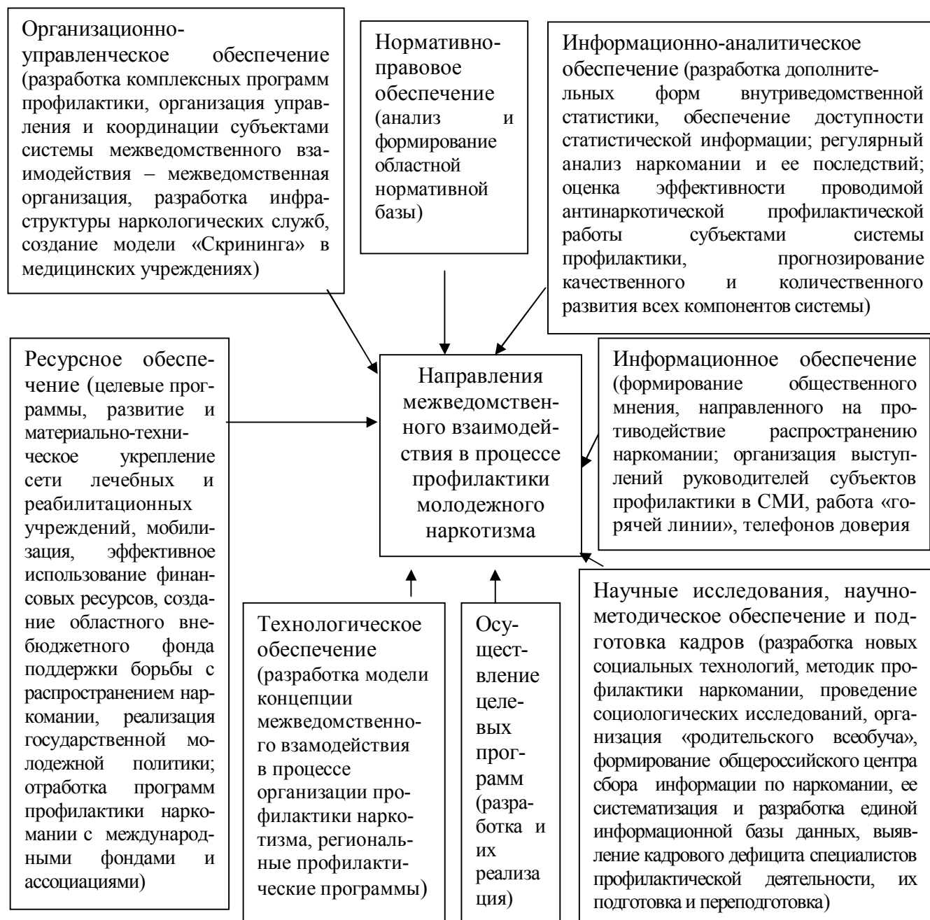
Схема 3. Направления межведомственного взаимодействия в процессе профилактики молодежного наркотизма

Конкретные меры по объединению усилий государства и общества в решении задачи социальной профилактики наркотизма должны быть направлены на ликвидацию социальных корней наркотизма и создание общей высокоэффективной системы избавления государства в целом от угрозы наркотического вырождения и социального хаоса 45 .